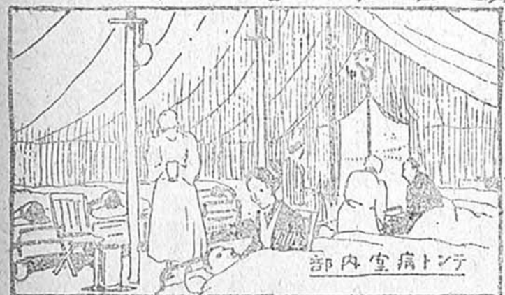
テント病院室内部