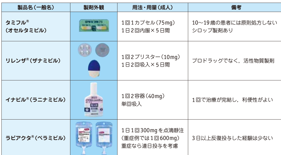
表 ノイラミニダーゼ阻害薬

□ 48時間以上経過している患者へのNA阻害薬の投与は、その有効性を示すデータがないため、行わないのが一般的である。